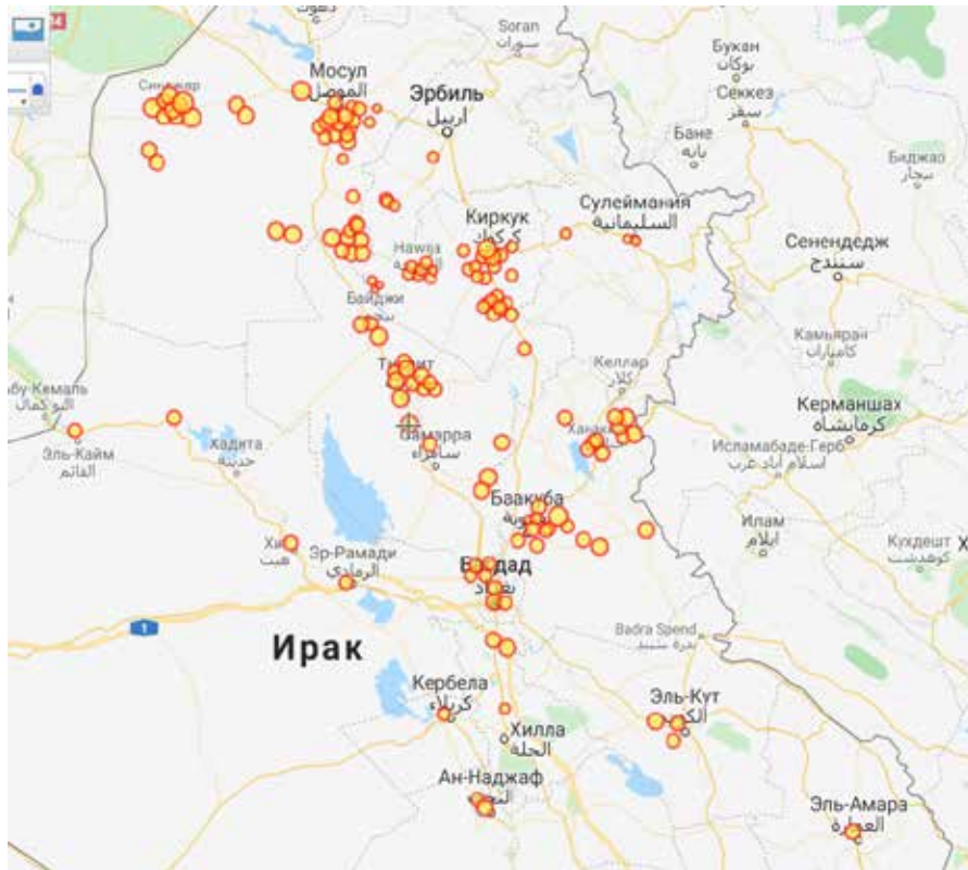
Рис. 3. Карта підпалів полів в Іраку. Травень-червень 2019 року