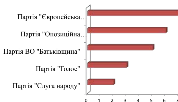
Рис. 1. Індекс ідеологічності українських партій, що представлені у Верховній Раді України

Для цього було проведено контент-аналіз програм релевантних українських політичних партій за методикою, яка була розроблена О. Агарковим і спрямована на визначення напряму ціннісно-іде-