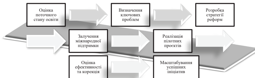
Рис. 3. Алгоритм підтримки освітніх реформ