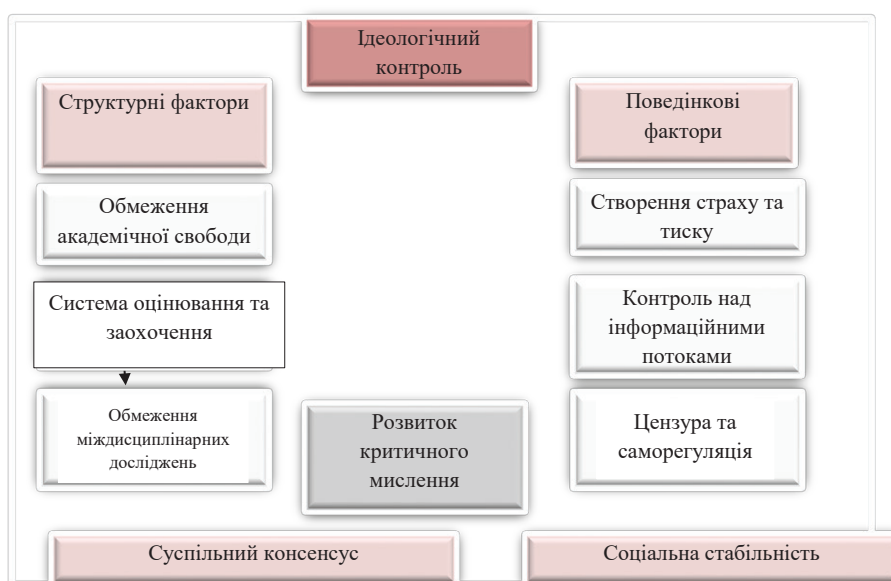
Рис. 2. Структурні та поведінкові фактори впливу ідеологічного контролю

В сучасному світі стратегічний вибір методів протидії ідеологічному впливу в освітніх системах є критично важливим для збереження академічної свободи, підтримки критичного мислення та забезпечення соціальної стабільності. Ідеологічний контроль, що накладається на освітні процеси,