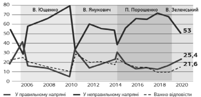
Рис. 3. Динаміка думок щодо правильності подій

– Підміна відсотками реальних кількостей для приховання недостатності вибірки. При аналізі двовимірних таблиць (як представники того чи того регіону, вікової групи, прихильники партій відповідають на ті чи ті запитання) важливим критеріям