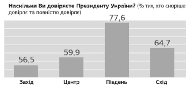
Рис. 1. Стовпчикова діаграма

Маніпуляції при візуалізації даних можуть умисно використовуватися для того, аби спотворити реальне співвідношення між певними явищами в уяві споживача інформації. Одним з найпоширеніших видів таких спотворень є маніпуляції з віссю ординат. Нижченаведена стовпчикова діаграма (рис. 1) ілюструє регіональний розподіл відповідей на запитання про довіру до Президента в опитуванні, проведеному Фондом «Демократичні ініціативи» спільно з Соціологічною службою Центру Разумкова у грудні 2019 року.