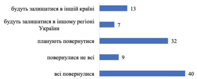
Діаграма 3. Чи планують повернутися або вже повернулися члени сім'ї? (Дані стосуються домогосподарств, члени яких виїжджали)

Навіть у ситуаціях, коли військові дії ще не закінчилися, з певними загрозами для життя та з великими руйнуваннями, обмеженнями та негараздами, які перешкоджають поверненню до нормального життя, населення має оцінити перспективи та, зокрема, готовність тих, хто виїхав, повернутися. Жителі, як правило, повертається до громад, які не перебувають у зонах бойових дій. Таким чином, 40% домогосподарств, члени яких виїхали, повернулися всі, тоді як інші 9% домогосподарств повернулися частково. Тобто половина сімей, роз'єднаних війною, повністю або частково возз'єдналися. 32% домогосподарств, члени яких виїхали, наразі планують повернутися. А серед сімей, які виїхали, 20% членів родини взагалі не мають наміру повертатися (Діаграма 3). Кількість людей, які вирішили не повертатися, може бути непрямим показником того, наскільки успішно інтегрувалися на новому місці.