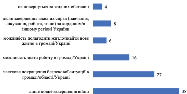
Діаграма 4. Що може впливати на рішення повернутися? (Дані стосуються домогосподарств, члени яких виїжджали)

Крім того, 6% домогосподарств, члени яких виїхали, готові повернутися, якщо їх житло буде відновлено. Можна припустити, що це частина представників родини, які частково або повністю втратили житло. Чітко виявлено серед всіх респондентів загальне відчуття небезпеки, яке не проходить. 13,7% респондентів відчували себе небезпечно вдома, а 12,7% – у громаді, хоча в період дослідження на більшості територій активні бойові дії вже не ведуться. За оцінками респондентів, близько 65% почуваються більш-менш безпечно у своїх громадах. Лише кожен п'ятий респондент відчував себе в цілковитій безпеці: 20,8% відчували себе в цілковитій безпеці вдома, а 22,4% – у громаді.