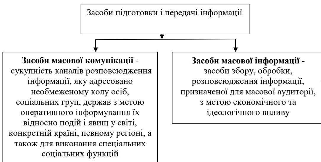
Рис. 2. Засоби підготовки і передачі інформації